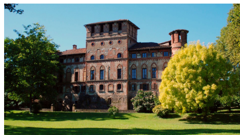
Castello di Piovera (AL)